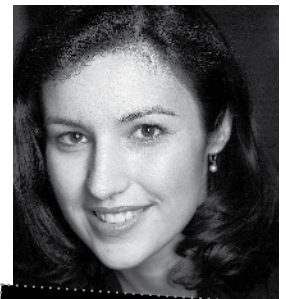
Dorothee Bär MdB

möchte ich meine Arbeitsschwerpunkte auf folgende Bereiche legen: Kultur und Medien, Innenpolitik, Familie