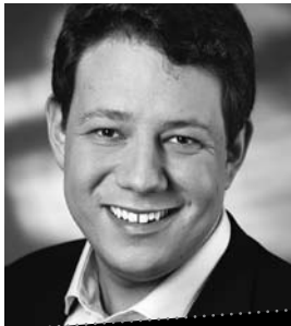
Philipp Mißfelder MdB